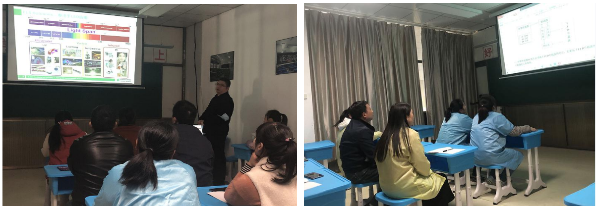
图 3.2-1 各类培训活动

公司将员工学习和发展视为“投资”，把创建学习型组织，营造全员学习的氛围作为公司长期发展战略的重要组成部分。随着公司规模扩大和全球化发展战略的实施，根据企业相关规定及各部门要求确定培训人员的需求情况。各部门负责人确定人员培训需求后经公司领导审批，相关部门每季度根据人员数量酌情进行培训计划的制定与实施。公司并成立了“萧科商学院”，见图 3.2-1 所示。