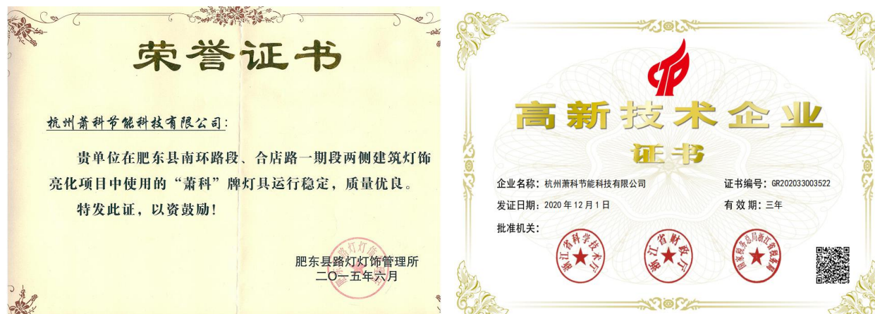
表3.3-1 公司诚信经营的成果

公司高层遵循“人无信不立，厂无信不存”的诚信共赢思想，从组织结构设计、工作流程优化、规章制度完善等方面为公司守法诚信经营创造了一个良好的环境，并在日常工作中带头践行。公司被授予杭州市高新技术企业、浙江省科技型中小企业、“萧科”牌灯具运行稳定，质量优良等荣誉，如图 3.3-1 所示：